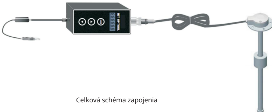
Celková schéma zapojenia

3.1 Inštalácia hardvéru, nainštalujte podľa nasledujúcej schémy: