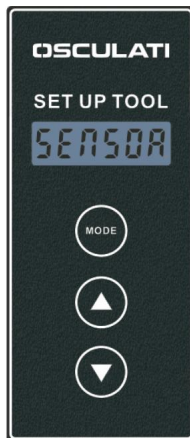
Zapnutie (Typ produktu)

Pomocou tlačidiel HORE/DOLE prepnite do rozhrania dopytu.