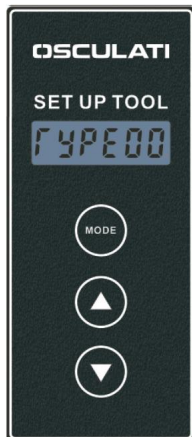
Typ vedľajšieho produktu

Nastavenie vedľajšieho produktu dokončené.