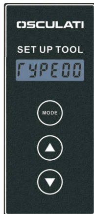
Typ vedľajšieho produktu