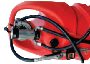
Disponibile anche per olio. Available for lubricants.

[EN] Polyethylene tank for Fuels (Gasoline, Diesel Fuel, Ethanol) transport, homologated in accordance with ADR regulation; available also the version in exemption from ADR in accordance with paragraph 1.1.3.1 C ADR.