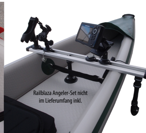
Railblaza Angler-Set nicht im Lieferumfang inkl.